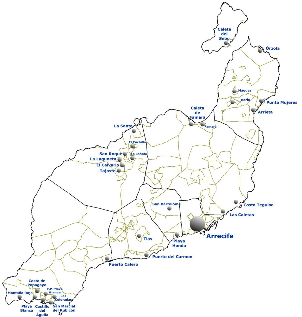
Mapa 3.- Núcleos de población con red de alcantarillado