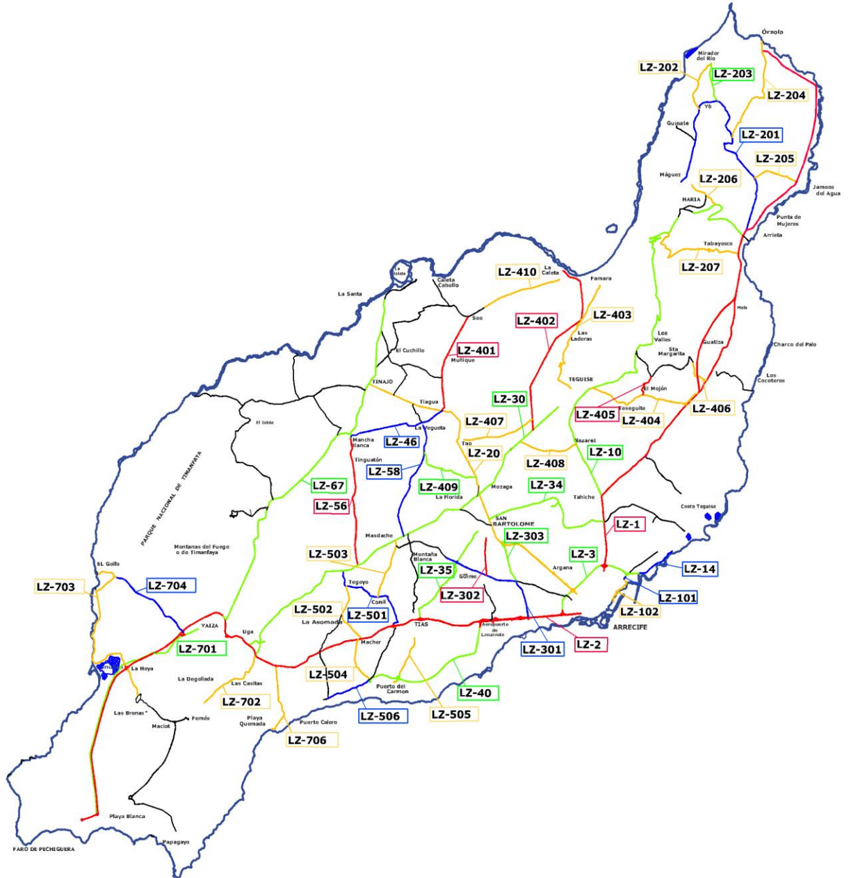
Mapa 1.- Carreteras de interés regional (LZ-1, LZ2 y LZ3 del Gobierno de Canarias) e insulares (Cabildo de Lanzarote)

FUENTE: Servicio de Carreteras. Cabildo de Lanzarote. ELABORACIÓN: Centro de Datos. Cabildo de Lanzarote.